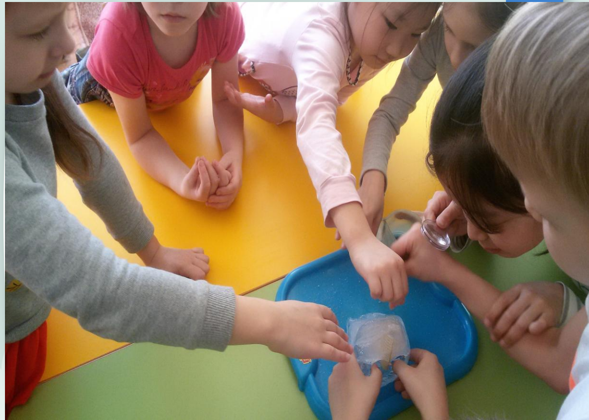
В роли палеонтологов. Раскопки динозавров в леднике.