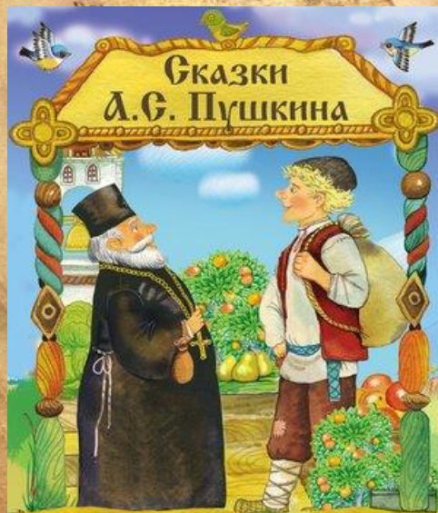
Сказка о рыбаке и рыбке Сказка о попе и о работнике его Балде