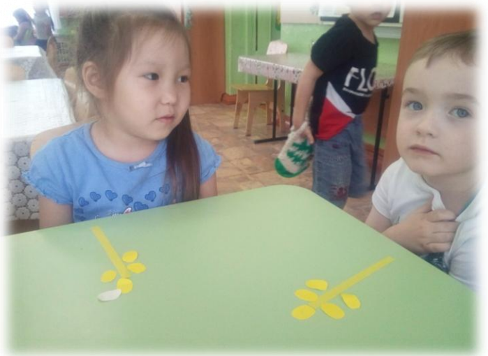
Узнали о разнообразии хлебобулочных изделий. Игра: "Чего не стало".