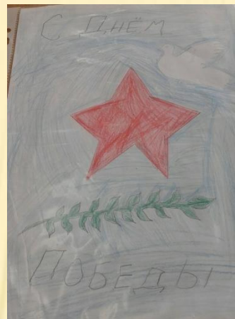
Рисунок Семёна Иванова