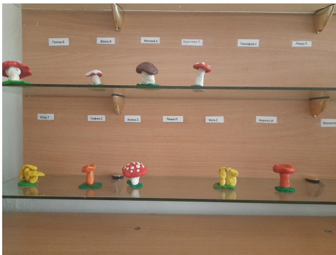
Лепка из пластилина «Дары осени. Грибы»