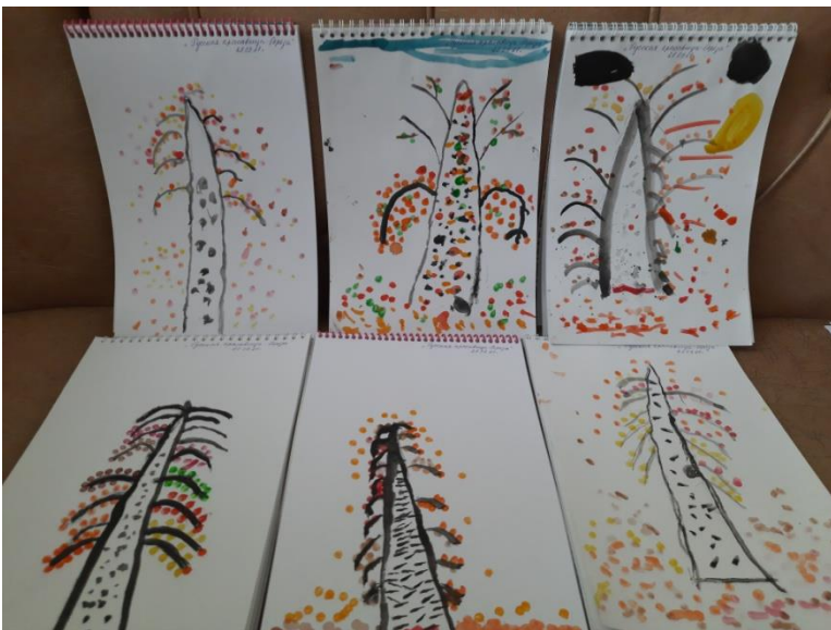
Рисование «Русская берёза осенью»