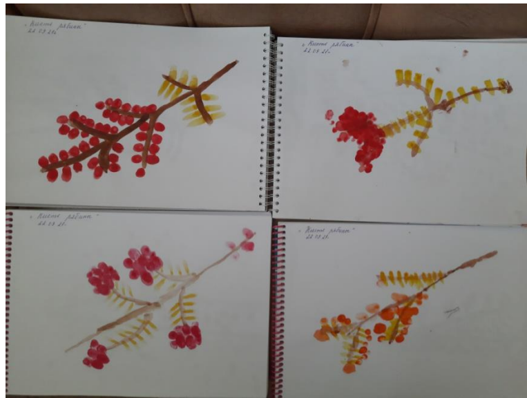
Рисование «Ветка рябины»