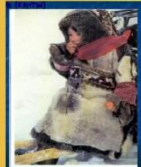
ЯРЫ - зимняя саамская обувь