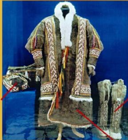
ПИМЫ, ЛИПТЫ - обувь