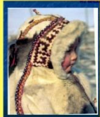
ТОБУРКИ - головные уборы