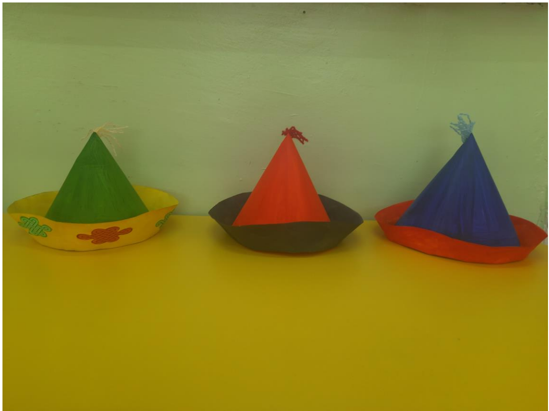
«Бурятские национальные шапочки»