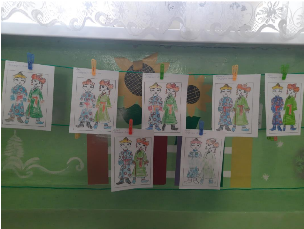
«Бурятский национальный костюм» Раскрашивание