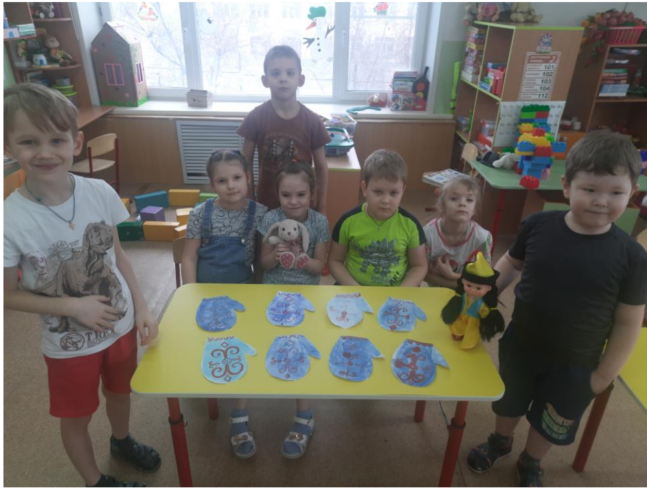
Рисование «Варежка» Бурятский орнамент