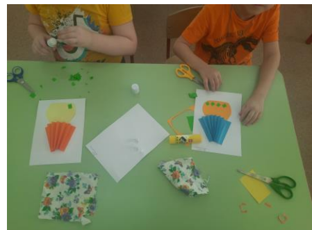
Аппликация «Подарок на Сагаалган»